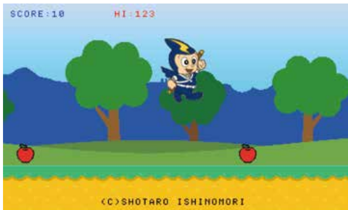
プログラム作成画面（前回の教室より）

SwitchでBASICプログラムを作るソフト「プチコン4」を使ってBASICのゲームプログラムを作ります