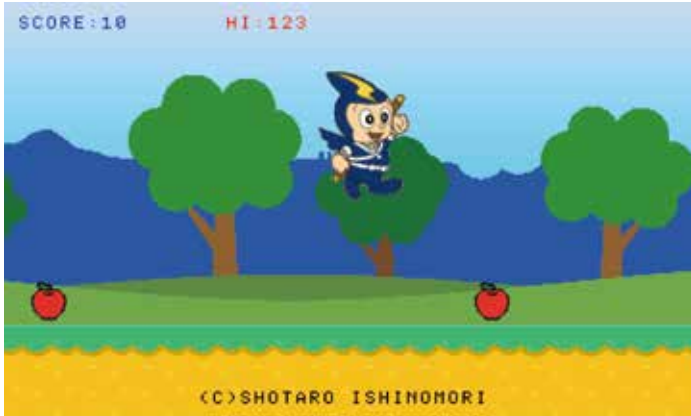
プログラム作成画面（昨年の教室より）

SwitchでBASICプログラムを作るソフト「プチコン4」を使ってBASICのゲームプログラムを作ります