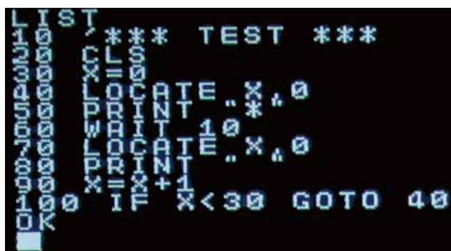
BASICプログラムのサンプル

★完成したマイコン・BASICプログラム・LED回路は持ち帰れます。液晶TVやキーボードは持ち帰りできません。