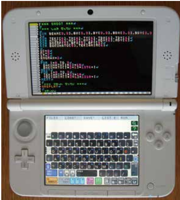
3DS用ソフト「プチコン3号」